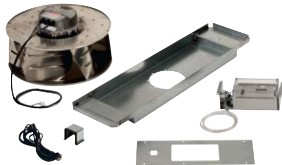
Umrüstkit zehnder flimmer E12000